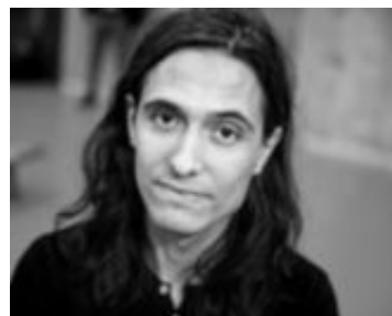
JONAS HASSAN KHEMIRI.

"VARFÖR ANVÄNDER DU ett kränkande språk?", "Har du ritualer när du skriver? Typ att du sitter